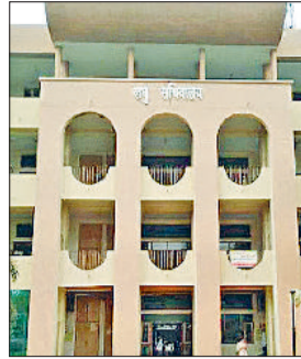
बंद कर दी, जिनकी वार्षिक आय तीन लाख रुपये से अधिक है। जिले में इस समय प्रतिदिन 150-200 शिकायत अधिकारियों के पास पेंशन बंद होने को लेकर पहुंच रही हैं।