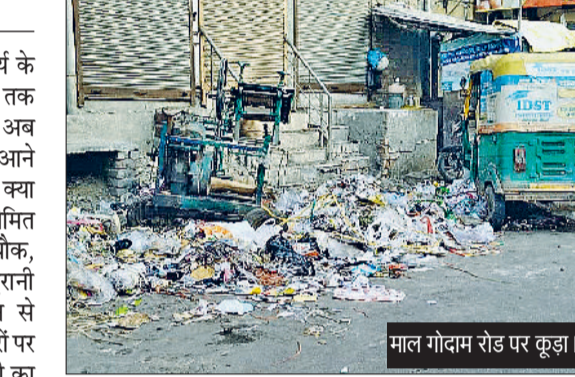
माल गोदाम रोड पर कूड़ा।

शहर में हाल के दिनों में स्वीपिंग कार्य के बाद मुख्य सड़कों की सूरत काफी हद तक बदल गई है। कई इलाकों में सड़कें अब साफ-सुथरी और चकाचक नजर आने लगी हैं। लेकिन सवाल यह है कि क्या सफाई केवल सड़क के बीच तक ही सीमित रहेगी। माल गोदाम रोड, शांतमई चौक, अग्रसेन चौक से लगती गली, पुरानी आईटीआई क्षेत्र और रेलवे स्टेशन से बजरंग भवन फाटक तक सड़क किनारों पर पड़ा कचरा अब भी लोगों की परेशानी का कारण बना हुआ है। स्थानीय लोगों का कहना है कि स्वीपिंग के बाद सड़कें तो साफ दिखती हैं, लेकिन दोनों ओर साइड में कूड़ा-कचरा जस का तस पड़ा हुआ है। कहीं प्लास्टिक और पॉलिथीन के डेरा हैं तो कहीं मिट्टी, पत्ते और धरलू कचरा जमा है। खासकर माल गोदाम रोड और अग्रसेन चौक के आसपास की गलियों में हालात ज्यादा खराब हैं। यहां से रोजाना सैकड़ों लोग गुजरते हैं, लेकिन बंदूक और गंदगी के कारण राहगीरों को नाक बंद कर चलना पड़ता है। पुरानी आईटीआई के आसपास सड़क किनारे लंबे समय से कचरा जमा है। इसी तरह रेलवे स्टेशन से बजरंग भवन फाटक तक का इलाका भी सफाई के इंतजार में है। यह क्षेत्र न केवल व्यस्त है, बल्कि यहां बाहर से आने-जाने वाले यात्रियों की भी आवाजाही रहती है। ऐसे में गंदगी शहर की छवि पर भी सवाल खड़े करती है। लोगों का कहना है कि जब शहर की सड़कों को चमकाया जा सकता है, तो इन इलाकों की सफाई क्यों नहीं।