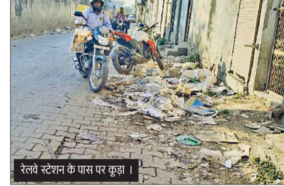
रेलवे स्टेशन के पास पर कूड़ा।