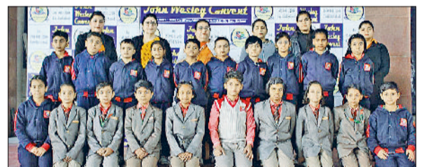
तार्किक सोच व निर्णय क्षमता का बताया आधार

गोहाना रोड स्थित जॉन वेस्ले कॉन्वेंट में आयोजित गणित वीक के उत्कृष्ट प्रस्तुति कर्ताओं को प्रोत्साहित करने के लिए विशेष सम्मान समारोह आयोजित किया गया। कक्षा पहली से नौवीं तक के विद्यार्थियों ने उत्साहपूर्वक भाग लेते हुए सुडोकू, क्रॉसवर्ड, मैथ्स क्विज, रिले रेस, ग्रीड एक्टिविटी और फनश्रीट जैसी तार्किक गतिविधियों में शानदार प्रदर्शन किया। विद्यार्थियों ने ज्यामितीय आकृतियों से कक्षा व